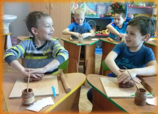
Занятия в детском саду