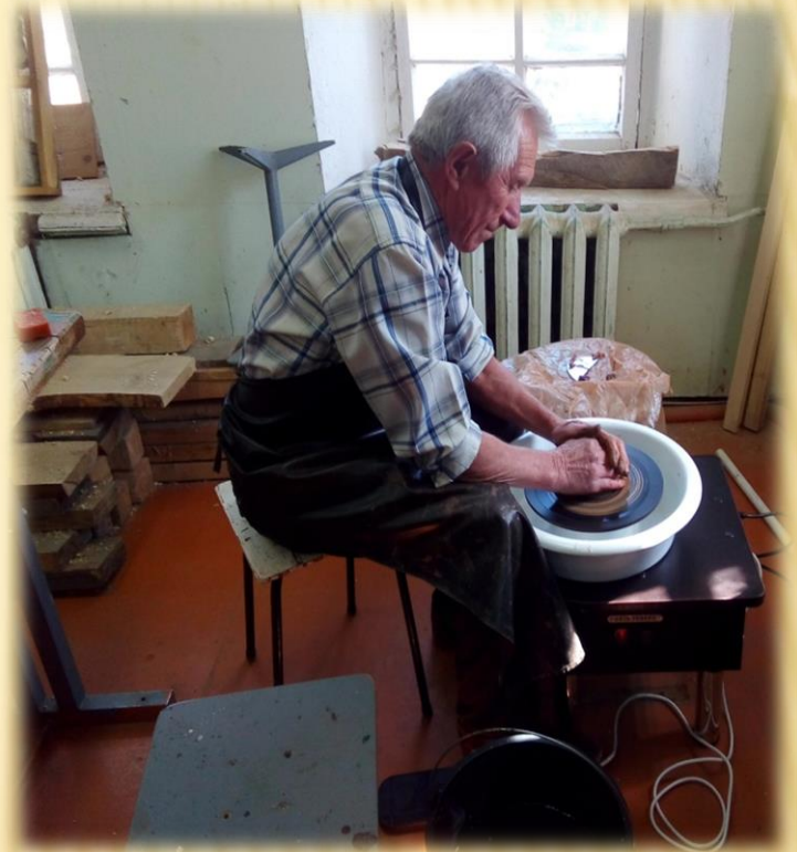
Клуб «Гончарных дел мастер»