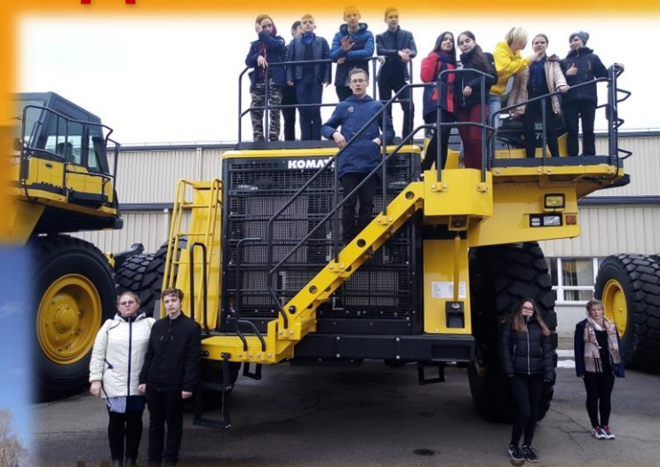
Машиностроительный завод «КАМАЗ»