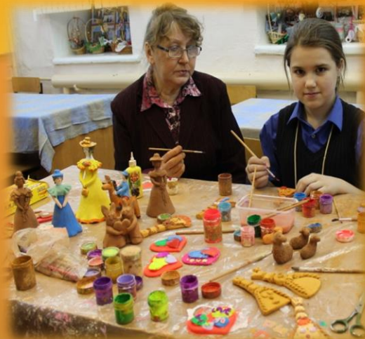
Занятия в школе