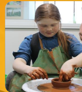
Занятия в Центре детского творчества