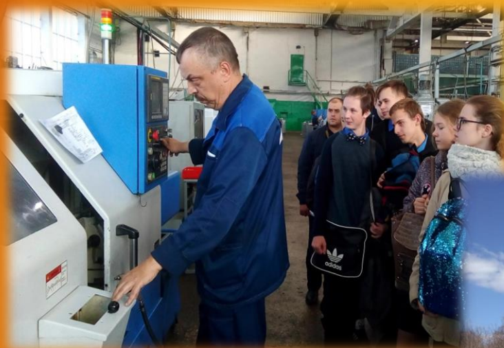
Машиностроительный завод «Агат»