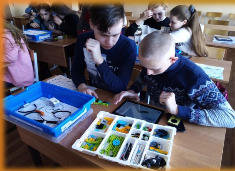
Робототехника в Ярославском пед.колледже