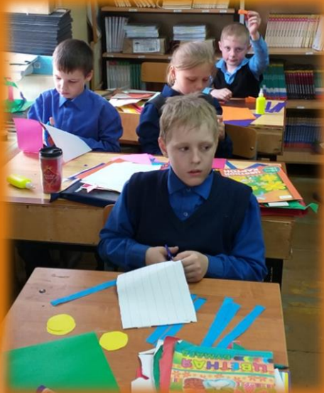
«Оригами» в младшей школе