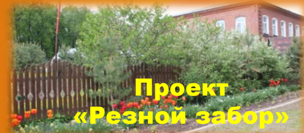
Проект «Резной забор»