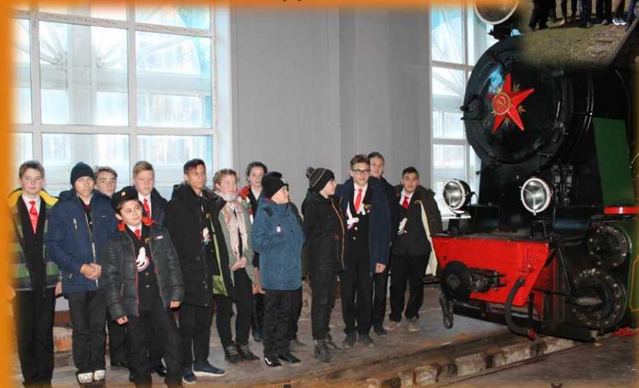
Посещение Детской железной дороги